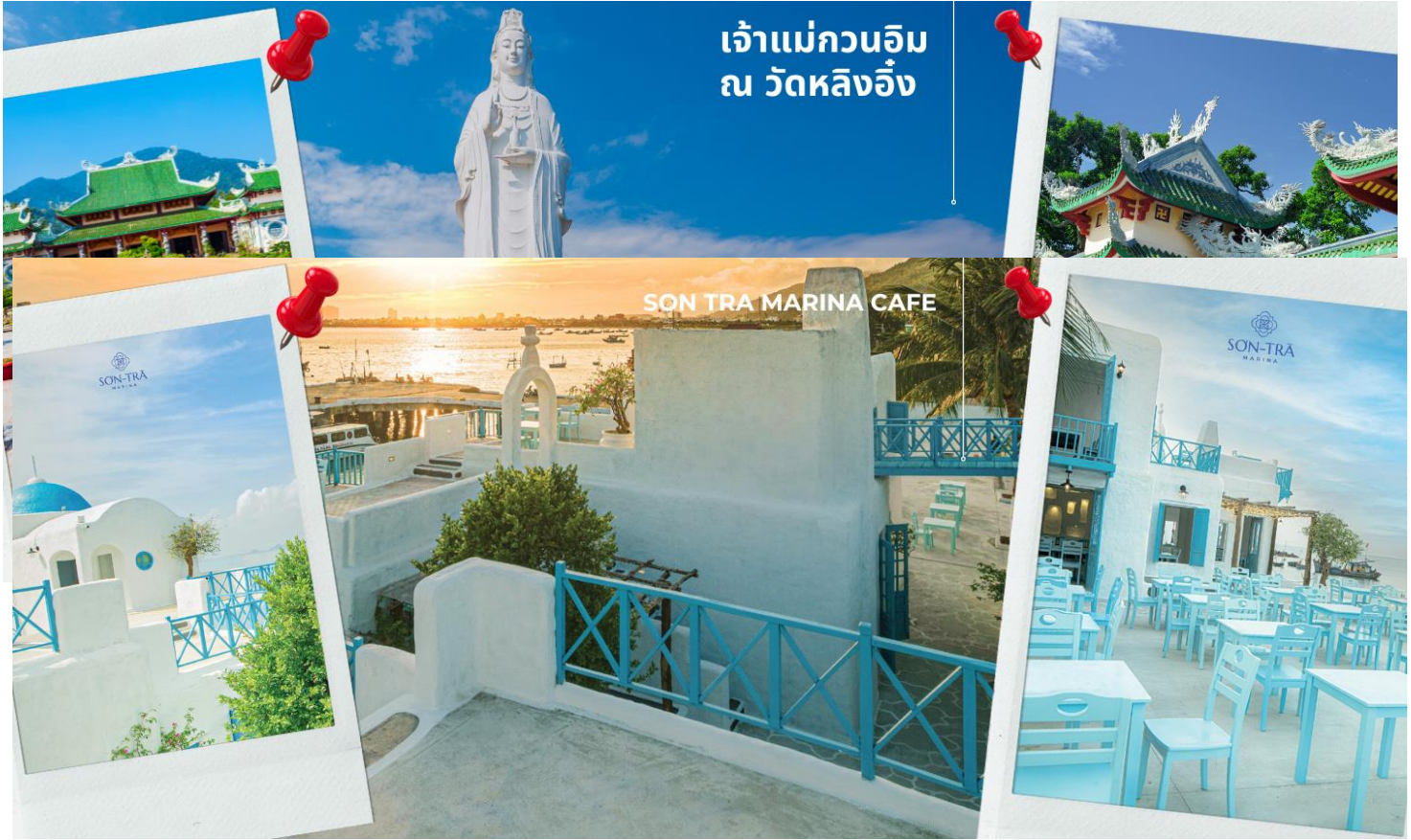
เจ้าแม่กวนอิม ณ วัดหลิงอิ่ง

นำท่านมัศจรรย์องค์ เจ้าแม่กวนอิม ณ วัดหลิงอิ่ง อยู่บนเกาะเซินตรา (Son Tra) ทางเหนือของเมืองดานัง เป็นวัดใหญ่ที่สุดของที่นี่ รูปปั้นปูนขาวของเจ้าแม่กวนอิมยืนหันหลังให้ภูเขา หันหน้าออกสู่ทะเลเพื่อเป็นการปกป้องคุ้มครองชาวประมงที่ออกไปหาปลา เสียงระฆังวัดที่ดีประสานกับเสียงคลื่นนั้นช่วยให้ชาวเรือรู้สึกสงบ