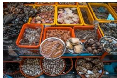
อันเลยทีเดียว

นำทุกท่านเดินทางสู่ ตลาดตลาดวอลด์คิงส์สตรีทนมโพดง (Nampodong) แหล่งช้อปปิ้งปูซาน แหล่งช้อปปิ้งอันดับต้นๆที่ชาช้อปปิ้งแหกทั้งหลายรู้จักกันเป็นอย่างดี เพราะย่านนี้ถือเป็น ศูนย์รวมแฟชั่นชั้นนำ ของหนุ่มสาวปูซาน และนักท่องเที่ยวเลยก็ว่าได้ หากอยากดูเทรนด์การ แต่งตัว เหล่สาวหน้าแดง หรือจะมองหนุ่มหน้าใส มาที่นี่รับรองว่าไม่ผิดหวังแน่ะ ถ้าจะให้ เปรียบก็คล้ายๆกับย่านสยามของบ้านเรานั่นเอง รวมถึงอาหารฟู้ดสตรีท อาหารท้องถิ่นต่างๆอีก