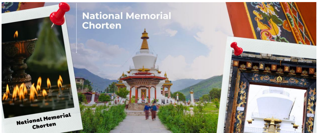
National Memorial Chorten

นำท่านชม National Memorial Chorten อนุสรณ์มหาสถานแด่กษัตริย์รัชกาลที่ 3 แห่งประเทศภูฏานส ร้างในปี ค.ศ.1974 มีผู้คนมากมายเดินทางมาแสวงบุญและสวดมนต์ประกอบพิธีกรรมทางศาสนาต่างๆ