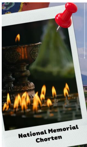
National Memorial Chorten

นำท่านเดินทางสู่ เมืองพูนาคา (Punakha) พูนาคา เป็นเมืองหลวงเก่าของภูฏานจนถึงปี ค.ศ. 1955 ก่อนที่จะย้ายเมืองหลวงไปที่เมืองทิมพู ระยะทางประมาณ 72 กิโลเมตร (ใช้เวลาประมาณ 3 ชั่วโมง) ระหว่างทางท่านจะได้ชมวิวทิวทัศน์ของทุ่งนาขั้นบันไดและดอกไม้ที่บานตลอดเส้นทางสวยงามเป็นอย่างมาก ผ่านชม ป้อมซิมโตคาซอง สร้างในปี ค.ศ.1629 ป้อมแห่งนี้มีชัยภูมิที่ถือเป็นยุทธศาสตร์ที่สำคัญแห่งเมือง ทิมพู ถือเป็นป้อมปราการแห่งแรกที่ท่าน ซบดรุง งาวัง นัมเกล สร้างขึ้น เมืองพูนาคาอยู่ระดับความสูง 1,200 เมตรจากระดับน้ำทะเล ทำให้เมืองพูนาคามีอากาศอบอุ่นกว่าเมืองพาโรและเมืองทิมพู