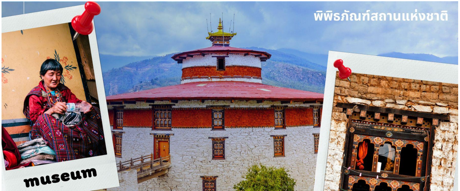
พิพิธภัณฑ์สถานแห่งชาติ

นำท่านเดินทางไม่ไกล ชม พิพิธภัณฑ์สถานแห่งชาติ พิพิธภัณฑ์แห่งนี้เป็นที่เก็บรวบรวมหน้ากากศิลปะแบบพุทธมหายาน ฝักดาบตันตระ ภาพพระบฏ อวูธ เหริยญกษาปณ์ เครื่องมือเครื่องใช้ไม้สอยต่างๆ รวมถึงจัดแสดงความหลากหลายทางธรรมชาติอันสมบูรณ์ของประเทศเพื่อให้ทุกท่านได้รู้จักภูฏานมากขึ้น ตรงข้ามกับอาคารพิพิธภัณฑ์ เป็นอาคารทรงกลมสีขาว เรียกว่า ตาซอง (Ta Dzong) หรือ หอคอย เดิมใช้เป็นหอสังเกตการณ์ข้าศึกศัตรูเนื่องจาก สร้างอยู่บนเนินสูง สามารถมองวิวตัวเมืองพาร์ได้โดยรอบ