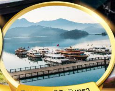
ทะเลสาบสุริยันจันทรา