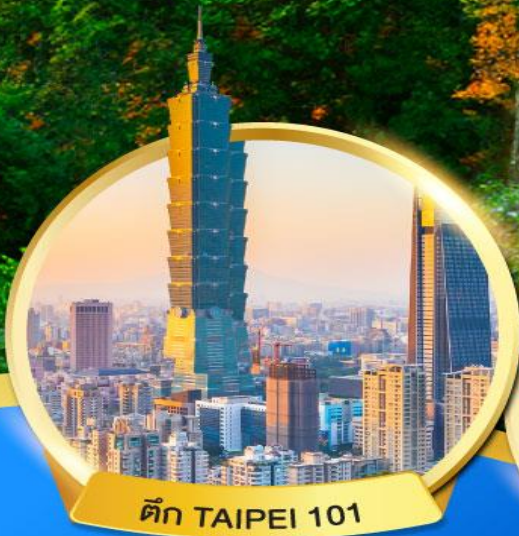
ตึก TAIPEI 101