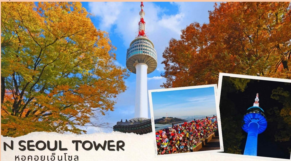
N SEOUL TOWER หอคอยเอ็นโซล

WATER DROP (ครีมหน้าแตก) , SNAIL CREAM (ครีมเมือกหอยทาก) , BOTOX (โบท็อกซ์) , ALOE VERA PRODUCT (ผลิตภัณฑ์จากสมุนไพร ว่านหางจระเข้) เป็นต้นหลังทานอาหารเย็น จากนั้นนำท่านสู่ หอคอยกรุงโซล N Tower (ไม่รวมค่าลิฟต์) ซึ่งอยู่บริเวณเนินเขานัมซานซึ่งเป็น 1 ใน 18 หอคอยที่สูงที่สุดในโลกที่ฐานของหอคอยมีสิ่งที่น่าสนใจต่างๆ เช่น ศาลาแปดเหลี่ยมपालก๊กจอง, สวนสัตว์เล็กๆ, สวนพฤกษชาติ, อาคารอนุสรณ์ผู้รักชาติอันซุงกุน อิสระให้ทุกท่านได้เดินเล่นและถ่ายรูปหอคอยตามอัธยาศัยหรือคล้องกุญแจคู่รัก