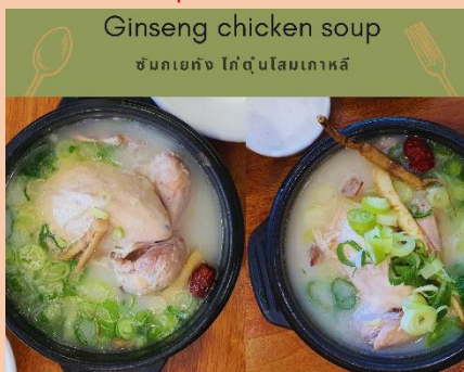
Ginseng chicken soup

📍รับประทานอาหารเย็น ณ ร้านอาหาร (มีที่ 6) เมนู Samgyetang หรือเมนูไก่ตุ๋นโสม เชื่อกันว่าบำรุงและเสริมสุขภาพ ภายในตัวไก่จะมีข้าวเหนียว รากโสม พุทราแดงและเคล็ดลับในการตุ๋นเสิร์ฟพร้อมเครื่องเคียงที่เรียกว่า กักตูกี เส้นขนมจีน เหล้าโสม พริกไทยดำ และเกลือ