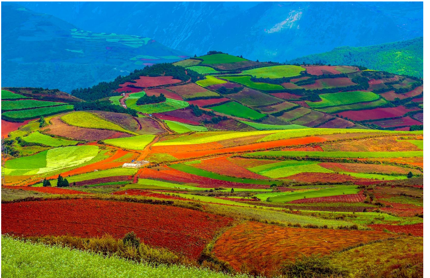
T2G-KMG08MU LOVELY SAKURA MUSTARD คุณหมิง ซากูระอิ์เหลียง ทุ่งมัสตาร์ด ภูเขาหิมะเจี๋ยจื่อ 4D 3N (MU)

นำท่านเดินทางสู่ แผ่นดินแดงตงชวน สถานที่ตั้งดินแดนสวรรค์ คือ ทุ่งเพาะปลูกแบบขั้นบันไดหลากสี มีฉากหลังเป็นภูเขาหิมะเจี๋ยจื่อและหมู่บ้านเล็กๆ ชมทิวทัศน์อันสวยงาม ต้นไม้เขียวที่เย็นเด่นตระการอยู่บนยอดเนินเขาอยู่เพียงต้นเดียวและทุ่งดอกไม้หลากสี ทำให้เกิดสีสันมากมายของดอกไม้ตัดกับพื้นดินสีแดงเข้มสลับกับสีท้องฟ้าสีฟ้าใส ตงชวนยังเป็นดินแดนบริสุทธิ์ที่รู้จักกันในหมู่นักถ่ายภาพชาวจีนและทั่วโลก ต่างยกย่องให้เป็นจุดที่มีภูมิทัศน์สวยงามที่สุดแห่งหนึ่งของประเทศจีน