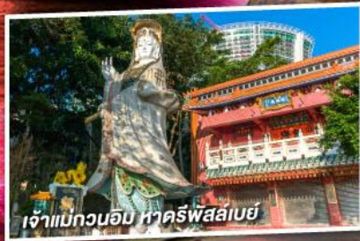
เจ้าแม่กวนอิม หาดรีฟส์เลย์