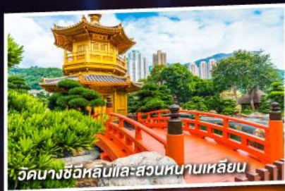
วัดนางชีอิหลินและสวนหินนานเหลียน