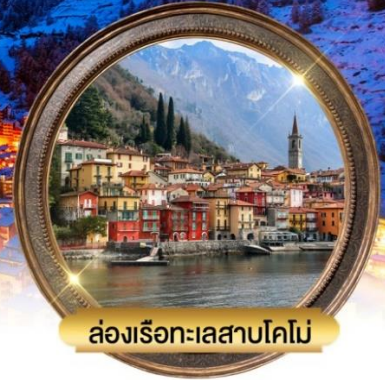
ล่องเรือทะเลสาบโคโม