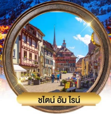
ชไตน์ อัม โรน