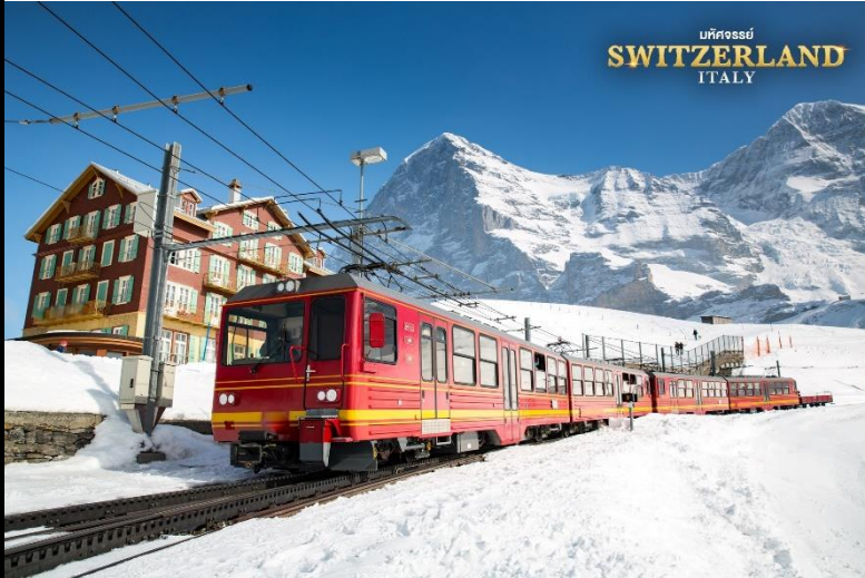
บรรยากาศของทิวทัศน์สุดอลังการ (มือที่ 8)

BT-EUR17_EK มหัทศจรชัย...สวิสเซอร์แลนด์ อิตาลี 9 วัน 7 คืน แวะช้อปปิ้งมิลาน