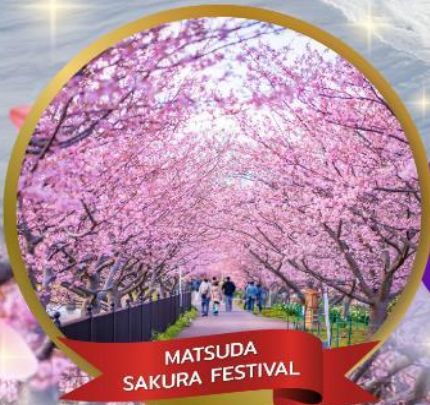
MATSUDA SAKURA FESTIVAL