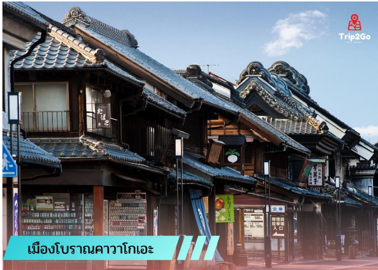
เมืองโบราณคาวาโกเอะ