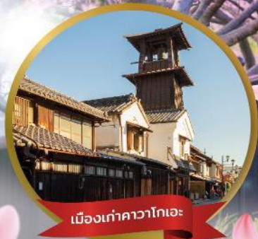
เมืองเก่าคาวาโกเอะ

ฟูจิออนเซ็น 2 คืน • บาร์ตะ 1 คืน • โตเกียว 1 คืน