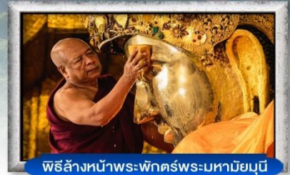
พิธีล้างหน้าพระพุทธรูปพระมหาเมียนุณี