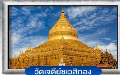
วัดเจดีย์ชเวสิกอง