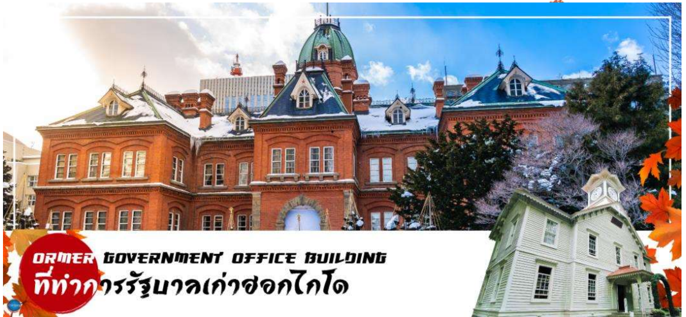
FORMER GOVERNMENT OFFICE BUILDING

จากนั้นนำท่านเดินทางสู่ เมืองซัปโปโร (SAPPORO) (ใช้เวลาเดินทางประมาณ 2.30 ชั่วโมง) นำท่าน ชม ศาลาว่าการเมืองซอกไกโดหลังเก่า ด้านนอก (Former Hokkaido Government Office) เป็นอาคารสีแดงอิฐ สร้างในปี 1888 นับเป็นอาคารขนาดใหญ่แห่งหนึ่งในไม่กี่อาคารของญี่ปุ่นในสมัยนั้น ภายในตกแต่งอย่างหรูหรา ด้านหน้ามีสัญลักษณ์ดาวห้าแฉก ธงรูปดาวเจ็ดแฉก และสวนหย่อมที่ร่มรื่น เรียงรายด้วยต้นซากุระ และต้นแปะก๊วย อาคารแห่งนี้เคยเป็นที่ทำการรัฐบาลท้องถิ่นสมัยบุกเบิกเกาะซอกไกโด ปัจจุบันเปิดให้ประชาชนเข้าชมห้องทำงานต่างๆ และหอสมุดเก็บบันทึกทางราชการ ผ่านชม หอนาฬิกาเมืองซัปโปโร (Sapporo Clock Tower หรือภาษาญี่ปุ่นเรียกว่า Sapporo Tokeidai) เป็นหอนาฬิกาโบราณมีลักษณะเป็นอาคารไม้ที่มีหลังคาสีแดงและผนังสีขาวถูกออกแบบและบริจาคให้โดยรัฐบาลสหรัฐอเมริกา ในปี ค.ศ. 1878 เป็นสัญลักษณ์ทางวัฒนธรรมและประวัติศาสตร์ของเมืองซัปโปโร สำหรับตัวนาฬิกาถูกติดตั้งในปี ค.ศ. 1881 จากบริษัท E. Howard & Co. เมือง Boston และในปี ค.ศ. 1970 หอนาฬิกาแห่งนี้ถูกกำหนดให้เป็นทรัพย์สินทางวัฒนธรรมที่สำคัญแห่งชาติ อีกด้วย