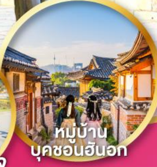
หมู่บ้าน บุคซอนอันอก