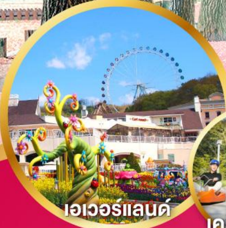
เอเวอร์แลนด์