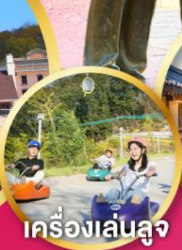
เครื่องเล่นลู่