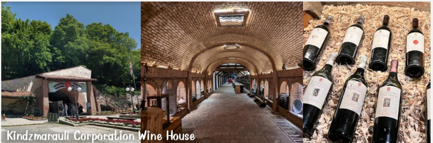
Kindzmarauli Corporation Wine House

นำทุกท่านลิ้มรสชาติไวน์ จากประเทศที่มีการผลิตไวน์มากที่สุดเป็นอันดับที่2ของชาติ และไวน์จอร์เจีย ได้รับรางวัลนานาชาติมากกว่าทุกชาติ ชาวจอร์เจียโบราณยังคิดค้นภาชนะใส่ไวน์เพื่อเก็บไว้ดื่มมานานๆเป็นดินเผาคล้ายไห เรียกว่า เควพรี (Qvevri หรือ Kvevis ) ปิดฝาด้วยแผ่นไม้ที่ทำไว้ขนาดพอดีกัน ผังลงไปในดิน สามารถเก็บไว้ได้นานหลายสิบปี ปัจจุบันยังคงใช้กันอยู่ และมีบางประเทศรื้อฟื้นนำกลับมาใช้