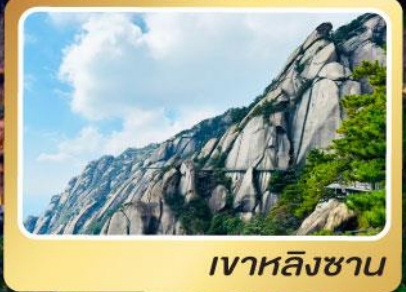
เวาหลิงซาน