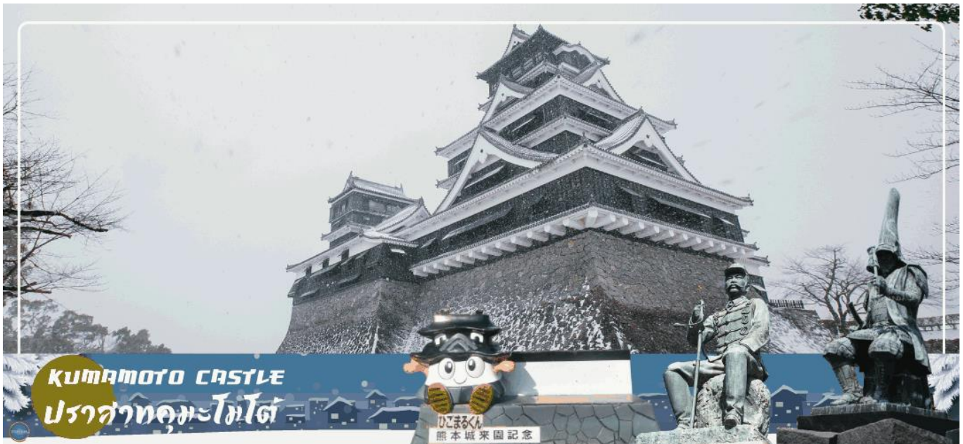
KUMAMOTO CASTLE ปราสาทคัมมะมงโตะ

ได้เวลาอันสมควรนำท่านเดินทางสู่ เมืองเบปปุ (Beppu) (ใช้เวลาเดินทางประมาณ 2 ชั่วโมง) เมืองในจังหวัดโออิตะ ตั้งอยู่บนชายฝั่งทะเลตะวันออกของเกาะคิวชู ประเทศญี่ปุ่น เป็นเมืองท่องเที่ยวชั้นนำพุดนวยอดนิยมนของญี่ปุ่น จัดเป็นเมืองที่มีรีสอร์ทหน้าแรกมากที่สุด นักท่องเที่ยวนิยมมาแช่ออนเซนหรืออบทรายร้อนริมทะเลที่เมืองนี้