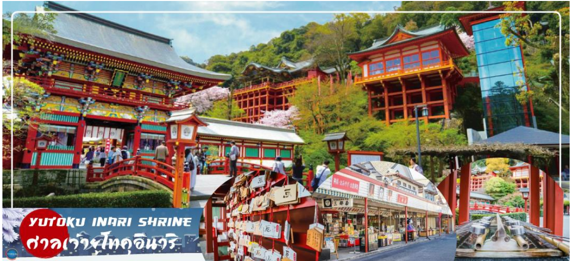
YUTOKU INARI SHRINE ศาลเจ้าโทคอินาริ

ศาลเจ้ายูโทคอินารินั้นถูกสร้างขึ้นเมื่อประมาณ ปี ค.ศ. 1688 ซึ่งเป็นศาลเจ้าที่อยู่ศาสนาพุทธนิกายชินโต และยังเป็นศาลเจ้าอินาริที่ใหญ่และสำคัญเป็นอันดับ 3 รองมาจาก ศาลเจ้าฟุชิมิอินาริ(Fushimi Inari Shrine)ในเกียวโต(Kyoto) และศาลเจ้าคะซะมาอินาริ(Kasama Inari Shrine) ในอิบาระกิ (Ibaraki)อีกด้วยนะคะ โดยศาลเจ้าแห่งนี้ได้เป็นศาลเจ้าประจำตระกูลนาเบะชิมะ(Nabeshima clan) ผู้ปกครองเมืองซากะ ในสมัยเอโดะอีกต่างหาก จึงเรียกว่าเป็นศาลเจ้าที่มีความสำคัญของเมืองและมีชื่อเสียงโด่งดังมากๆแห่งหนึ่งในระดับภูมิภาค