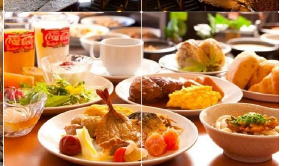
Hotel Kannawa Beppu

วันที่สาม บ่อนรกเบปปุ จิโกคุ เมกิริ (เข้าชม 2 บ่อ) - เมืองยุฟุอิน - หมู่บ้านยุฟุอินฟลอรัล - ทะเลสาบคิริน - เมืองฟุกุโอกะ - ศาลเจ้าดะไซฟุเทมมังกุ - ดิวตี้ฟรี - กันดั้ม پارค ฟุกุโอกะ