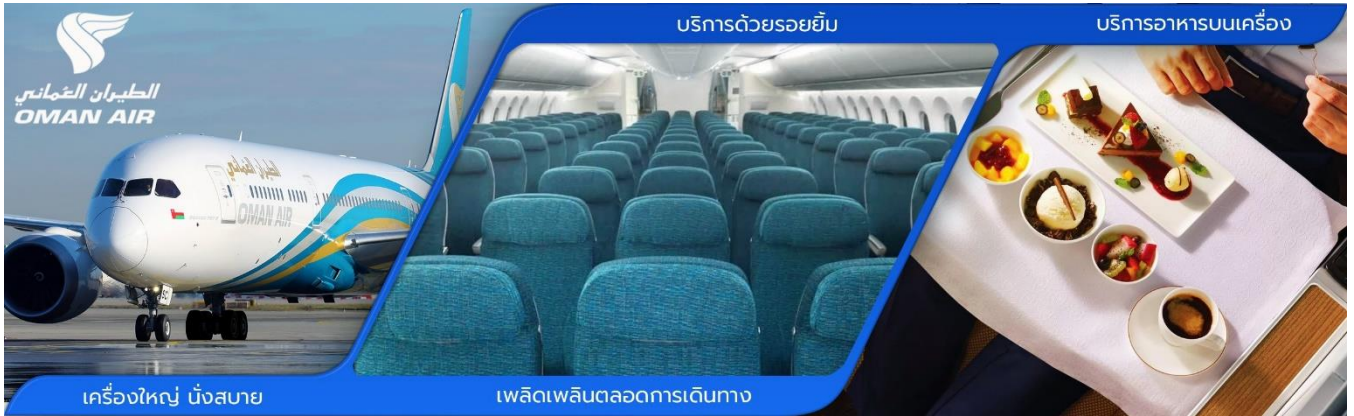
เครื่องใหญ่ นั่งสบาย