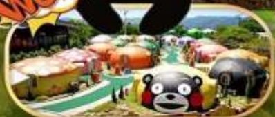
ASO FARM VILLAGE