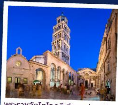
พระราชวังไดโอสซิเชียนแห่งสปลิท