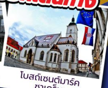
โบสถ์เซนต์มาร์ค ซาเกร็บ