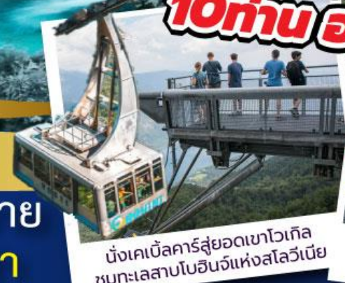
นั่งเคเบิลคาร์สูดอากาศไอเทิล ชมทะเลสาบโบฮินจ์แห่งสโลวีเนีย