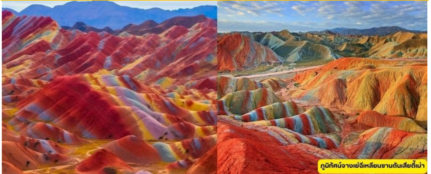
ภูมิตทัศน์จางเย่ฉีเหลียนซานต้นเสียดี้เม่า