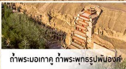
ถ้ำพระมอเกาคู ถ้ำพระพุทธรูปพันองค์