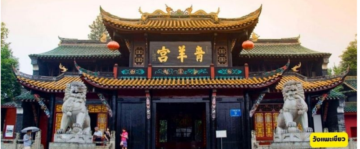
วัดแพะเขี้ยว