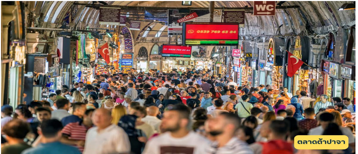
ตลาดต้าปาจารย์

วันที่หก ทูรฟาน – เมืองโบราณเกาลางกู๋ - ถ้ำพระพุทธรูปพันองค์ - คอนแอ้อจิ่ง - ภูเขาเปลวเพลิง - เมืองอูรูมูฉี - ต้าปาจารย์