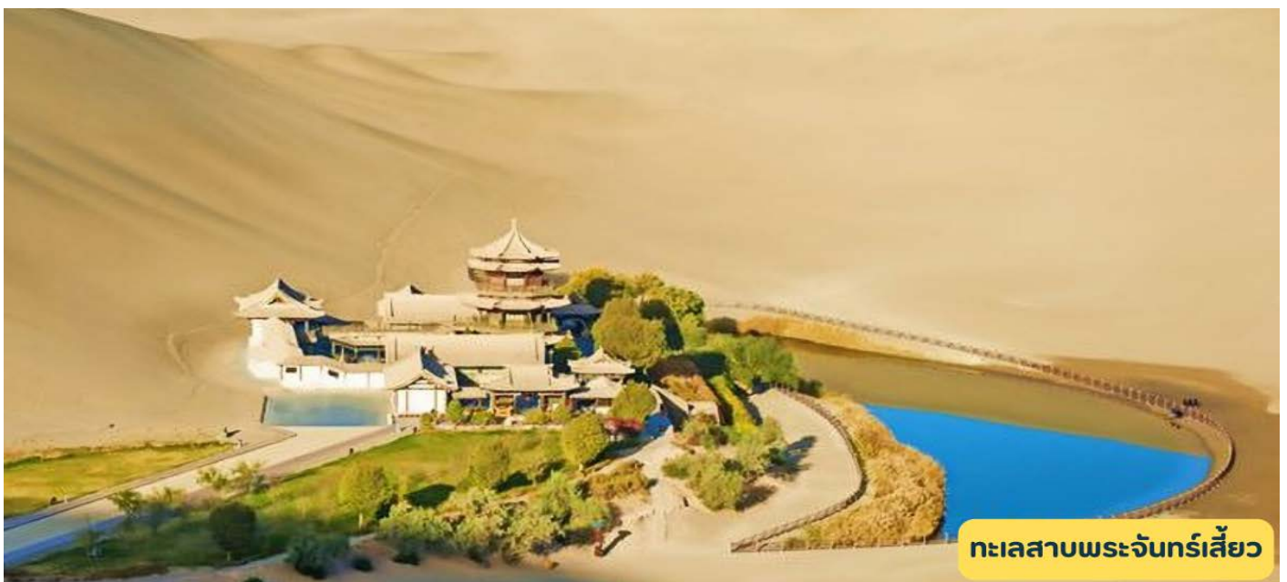
ทะเลสาบพระจันทร์เสี้ยว

วันที่สี่ เมืองเจียอี้กวน - จัตุรัสป้อมปราการ – ดูนหวง - หมิงซาซาน – ทะเลสาบพระจันทร์เสี้ยว