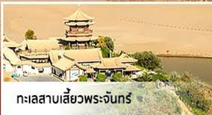
ทะเลสาบเสี้ยวพระจันทร์

ย้อนรอยเส้นทางประวัติศาสตร์ อารยธรรมหลายพันปี