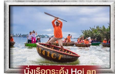
นั่งเรือกระดัง Hoi an