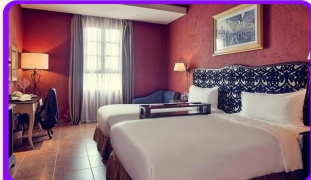
พักบนบานาฮิลล์ 1 คืน