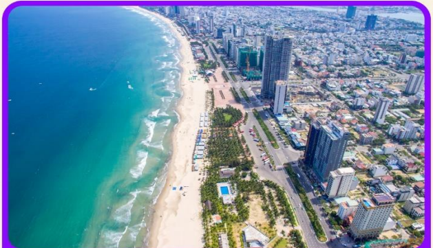
เช็किन ชายหาดหมีเคว เป็นชายหาดที่สวยงามที่สุดในเมืองดานัง