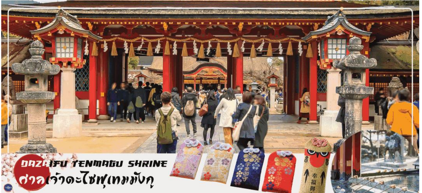
DAZAIFU TENMAGU SHRINE ศาลเจ้าตะไซฟูเทมมังกู

จากนั้นเดินทางสู่ เมืองฟูกุโอกะ (Fukuoka) (ใช้เวลาเดินทางประมาณ 2 ชั่วโมง) เป็นเมืองที่ใหญ่ที่สุดของเกาะคิวชู ประเทศญี่ปุ่น เป็นเมืองท่าที่สำคัญมานานหลายร้อยปี มีแหล่งท่องเที่ยวทางธรรมชาติ วัฒนธรรม ตลอดจนแหล่งช้อปปิ้ง และอาหารหลากหลาย เรียกว่าเป็นเมืองที่ครบครัน ทำให้เป็นที่นิยมของนักท่องเที่ยวจำนวนมาก