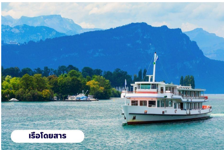
เรือโดยสาร

🍷 บริการอาหารเช้า ณ ห้องอาหารของโรงแรม จากนั้นนำท่านเดินทางสู่ ยอดเขาริกิ (Rigi Kulm) โดยใช้การเดินทางโดยเรือจากทะเลสาบลูเซิร์นไปยังท่าเรือวิทซ์เนา (Vitzanu) จากนั้นนั่งรถไฟไต่เขา Rigi ถือได้ว่าเป็นรถไฟไต่เขาที่เก่าแก่ที่สุดในยุโรป และยังเป็นอันดับ 2 รองจากยอดเขาวอชิงตัน โนมลรัฐนิวแฮมป์เชียร์ สหรัฐอเมริกา ความสูงจากระดับน้ำทะเล 1,797 เมตร จนมาถึงยอดเขาริกิ (Rigi Kulm) ชื่อนี้มีที่มาจากคำว่า Mons Regina แปลได้ว่าราชินีแห่งภูเขา เพราะสามารถมองเห็นทิวทัศน์ของยอดเขาอื่นๆ ได้รอบ 360 องศา ชมวิวแบบพาโนรามาโอบล้อมด้วยธรรมชาติของทะเลสาบ Luzern และ Zug อิสระทุกท่านถ่ายรูปชมวิวดตามอัธยาศัย