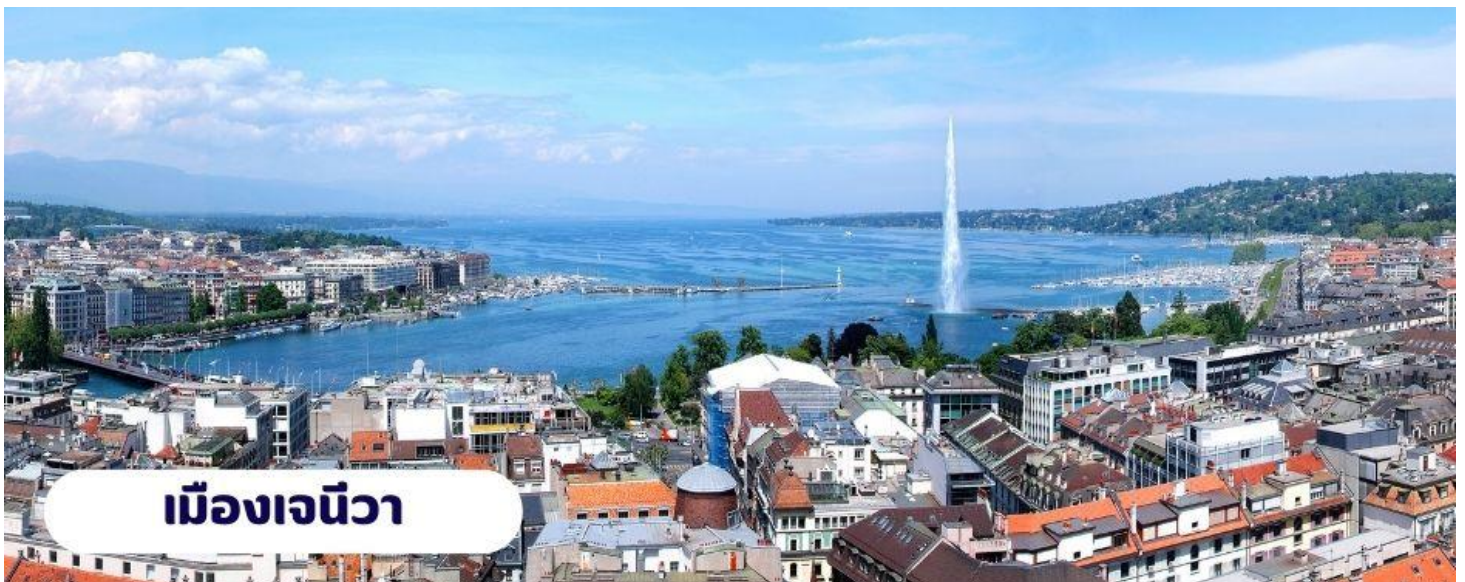
เมืองเจนีวา