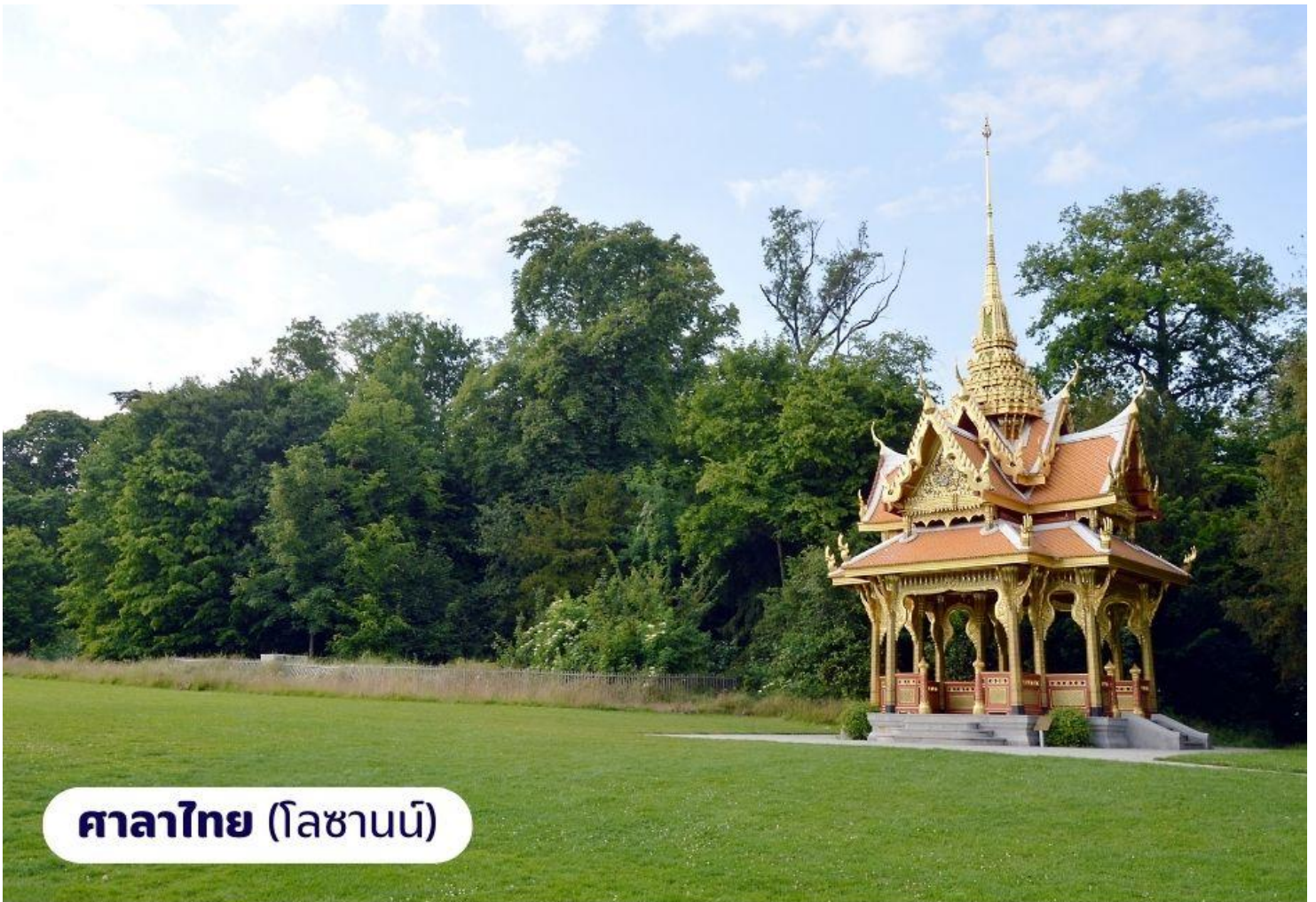
ศาลาไทย (โลซานน์)

จากนั้นนำท่านเดินทางไปยัง เมืองโลซานน์ เป็นอีกเมืองที่ตั้งอยู่บนของทะเลสาบเจนีวา เมืองโลซานน์นับได้ว่าเป็นเมืองที่มีเสน่ห์โดยธรรมชาติมากที่สุดเมืองหนึ่งของ สวิตเซอร์แลนด์มีประวัติศาสตร์อันยาวนานมาตั้งแต่ศตวรรษที่ 4 ในสมัยที่ชาวโรมันมาตั้งหลักแหล่งอยู่บริเวณริมฝั่งทะเลสาบที่นี่ เนื่องจากเมืองโลซานน์ตั้งอยู่บนเนินเขาริมฝั่งทะเลสาบเลคเจนีวา จึงมีความสวยงามโดยธรรมชาติ ทิวทัศน์ที่สวยงามและอากาศที่ปราศจากมลพิษ จึงดึงดูดนักท่องเที่ยวจากทั่วโลกให้มาพักผ่อนตากอากาศที่นี่ เมืองนี้ยังเป็นเมืองที่มีความสำคัญสำหรับชาวไทยเนื่องจากเป็นเมืองที่เคยเป็นที่ประทับของสมเด็จพระเจ้านำท่านถ่ายภาพ อาคารสำนักงานโอลิมปิกสากล ซึ่งตั้งอยู่บริเวณทะเลสาบเลคเจนีวา จากนั้นนำท่านถ่ายภาพและเยี่ยมชม ศาลาไทย ที่รัฐบาลไทยได้ร่วมกันก่อสร้างให้เมืองโลซานน์ ในวโรกาสเฉลิมฉลองพระบาทสมเด็จพระเจ้าอยู่หัวทรงครองราชย์ครบ 60 ปีและเชื่อมความสัมพันธ์ไทย-สวิสฯ ครบ 75 ปี