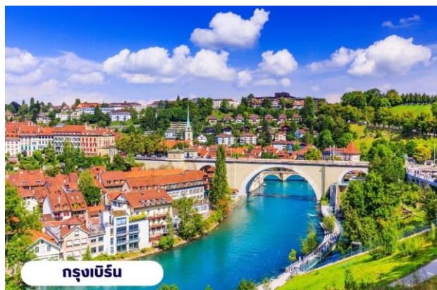
กรุงเบิร์น

☉ บริการอาหารเช้า ณ ห้องอาหารของโรงแรม จากนั้นนำท่านเที่ยวชมสถานที่สำคัญต่างๆในกรุงเบิร์น กรุงเบิร์นได้รับการยกย่องจากองค์การยูเนสโกให้เป็นเมืองมรดกโลก ในปี ค.ศ. 1863 นอกจากนี้เบิร์น ยังถูกจัดอันดับอยู่ใน 1 ใน 10 ของเมืองที่มีคุณภาพชีวิตที่ดีที่สุดในโลกในปี ค.ศ. 2010 นำท่านชม บ่อหมีสีน้ำตาล สัตว์ที่เป็นสัญลักษณ์ของกรุงเบิร์น นำท่านชม มาร์กาสเซ ย่านเมืองเก่า ปัจจุบันเต็มไปด้วยร้านดอกไม้และบูติก เป็นย่านที่ปลอดภัยยิ่งเหมาะกับการเดินเที่ยวชมอาคารเก่า อายุ 200-300 ปี นำท่านลัดเลาะชมถนนจุงเคอร์นกาสเซ ถนนที่มีระดับสูงสุดของเมืองนี้ ซึ่งเต็มไปด้วยร้านภาพวาดและร้านขายของเก่าในอาคารโบราณ ชมนาฬิกาใช้ทศล้อคเคนทรม์ อายุ