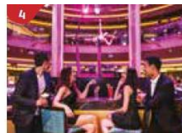
Bar 360 Catch live music and aerial acrobatic performances with a glass of champagne.