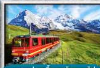
เขาจุงเฟราว ขึ้นกระเช้า สรงกไฟ