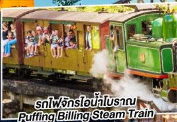
รถไฟจักรไอน้ำโบราณ Puffing Billing Stream Train