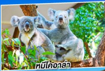
หมีโคอาลา