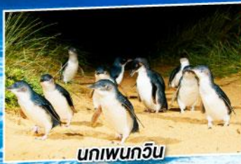
นกเพนกวิน