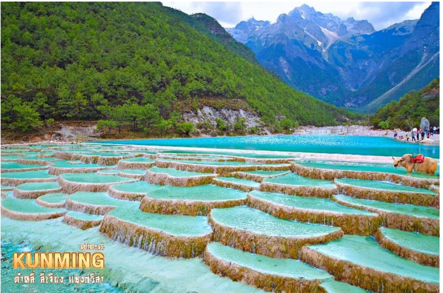
มหัสถอร์ณี KUNMING ต้าตี่ สี่เจียง แสงกรีล่า

ชมความงดงามผืนน้ำสีเทอควยซ์ของ ทะเลสาบไปสุยเหอ ทะเลสาบที่อยู่อีกด้านหนึ่งของภูเขา หิมะมังกรหยก น้ำในทะเลสาบแห่งนี้ไหลลงมาจากการละลายของหิมะบนภูเขาหิมะมังกรหยก