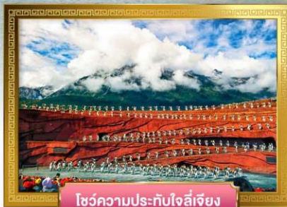
โชว์ความประทับใจลี้เจียง