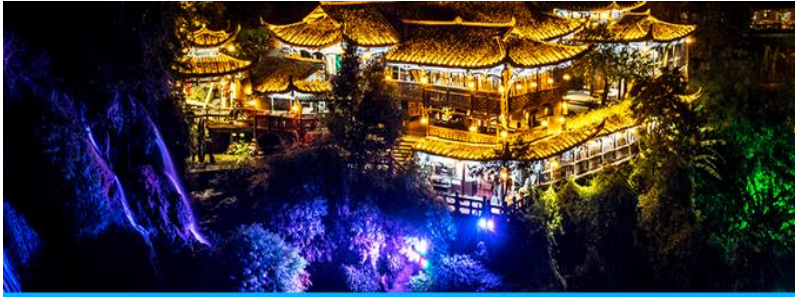
เมืองโบราณฟูหรงจิ้น