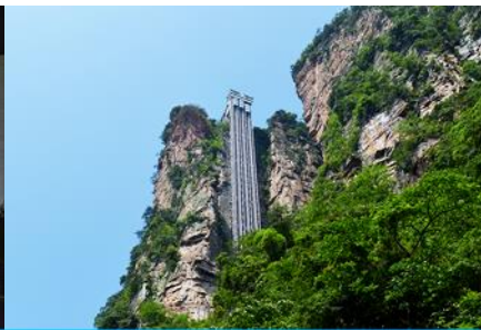
ลิฟท์แก้วไปหลวง