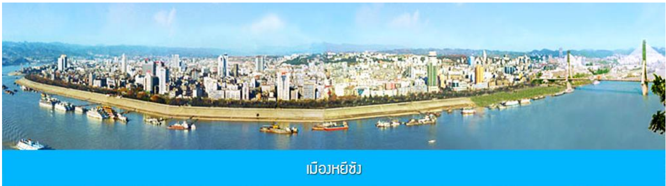
เมืองหยีซาง