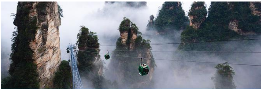
กระเช้าลางจากเขาเทียนจื่อซาน

พักที่ ShanDing PengQuange resort บนเขาฝ่งหยวนเจี๋ยเจี๋ย