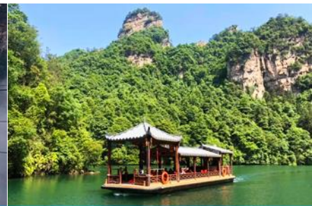
ล่องเรือทะเลสาบ เป่าเฟิงหู