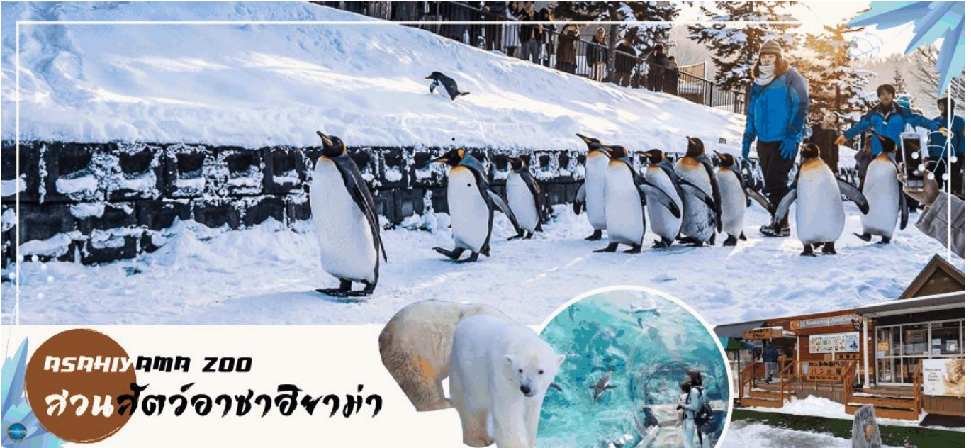
Asahiyama Zoo สวนสัตว์อาซาฮิยาม่า