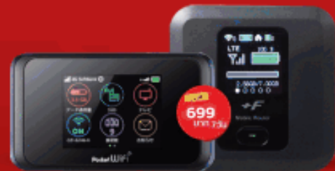
POCKET WIFI สำหรับท่านที่ต้องการพกพาอินเทอร์เน็ตไปทั่วโลก