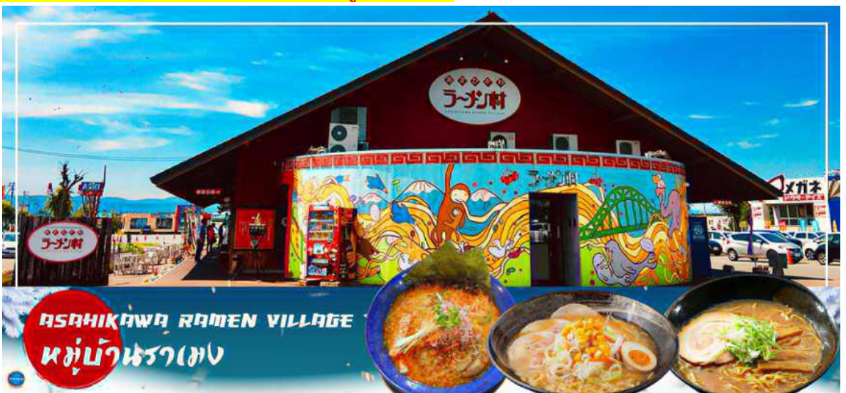
Asahikawa Ramen Village หมู่บ้านราเมง

อิสระรับประทานอาหารกลางวัน ณ หมู่บ้านราเมง