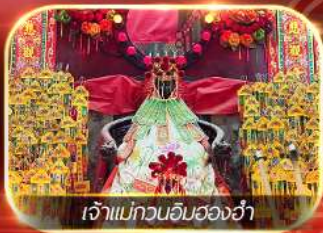
เจ้าแม่กวนอิมสองอ้า