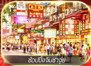
ช้อปปิ้งจิมซาจุ้ย