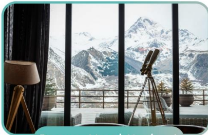
Rooms Hotel Kazbegi

พัก Rooms Hotel Kazbegi ลังการชมวิวหลักล้าน 8วัน 6คืน BY 6E