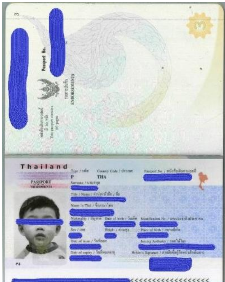
รูปถ่ายขนาด 2*2 นิ้ว