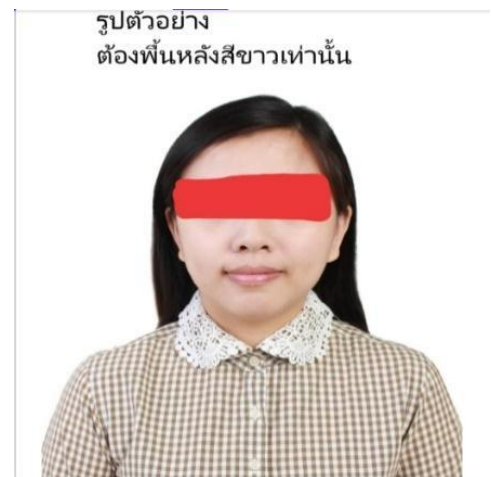
รูปตัวอย่าง ต้องพื้นหลังสีขาวเท่านั้น