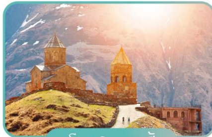
โบสถ์เกอเกดี