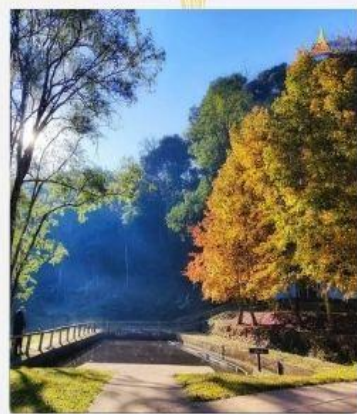
โครงการ บ้านเล็กในป่าใหญ่