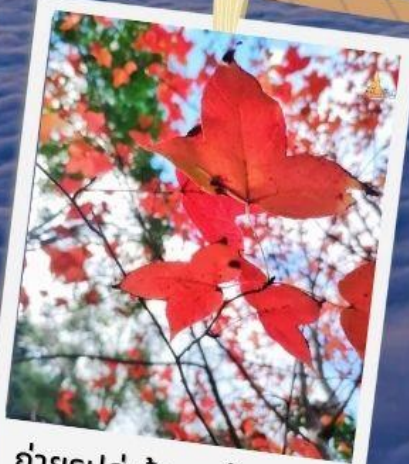
ถ่ายรูปคู่ ต้นเมเปิ้ลแดง