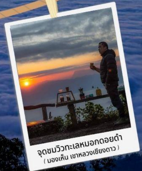
จุดชมวิวกะเลหมอกดอยดำ (มองเห็น เขาลองเชียงดาว)