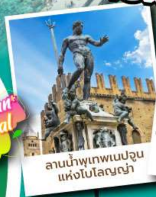
ลานน้ำพุเทพเนปจูน แห่งโบโลญญา