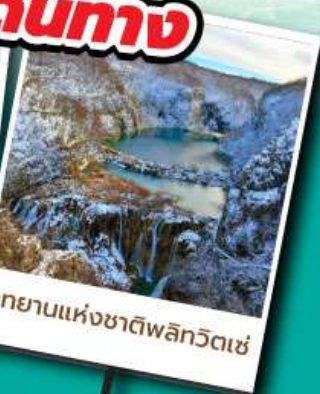
อุทยานแห่งชาติฟลิกริตเซ่