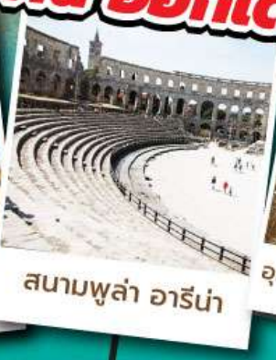
สนามพูล่า อารีน่า