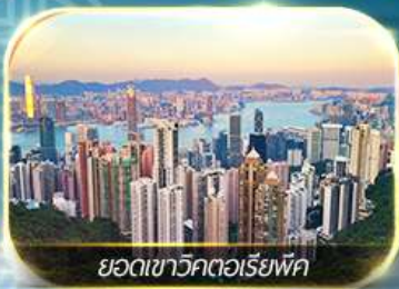
ยอดเขาวีคตอเรียพีค