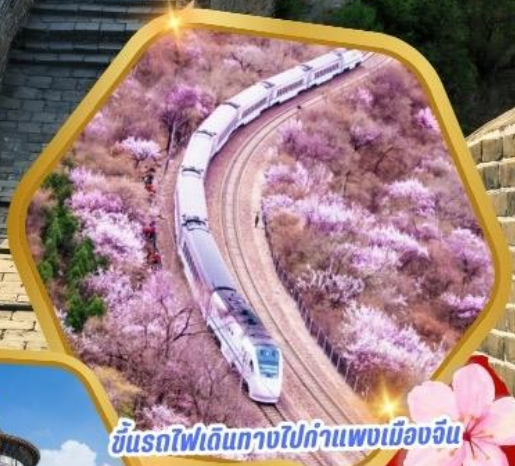
ขบวนรถไฟเดินทางไปกำแพงเมืองจีน