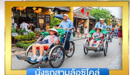
นั่งรถสามล้อชิโคล์