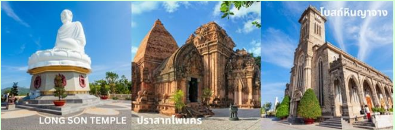
LONG SON TEMPLE

จากนั้นนำท่านชม โบสถ์หินนาตรัง เป็นโบสถ์ที่ใหญ่ที่สุดในเมืองญาจาง ตั้งโดดเด่นอยู่บนเนินสูง 10 เมตร ห่างจากทะเลเพียงแค่ 1กิโลเมตร โบสถ์หลังนี้ถูกสร้างขึ้นในสไตล์ฝรั่งเศสโกธิกโดยนักบุญหลุยส์วอลเล่ย์ ภายในโบสถ์ถูกตกแต่งด้วยกระจกสี มีสีอันสวยงาม ด้านในสามารถจุคนได้ถึง 600 คน ตัวโบสถ์ถูกสร้างด้วยบล็อกซีเมนต์ และใช้หินในการปูพื้น